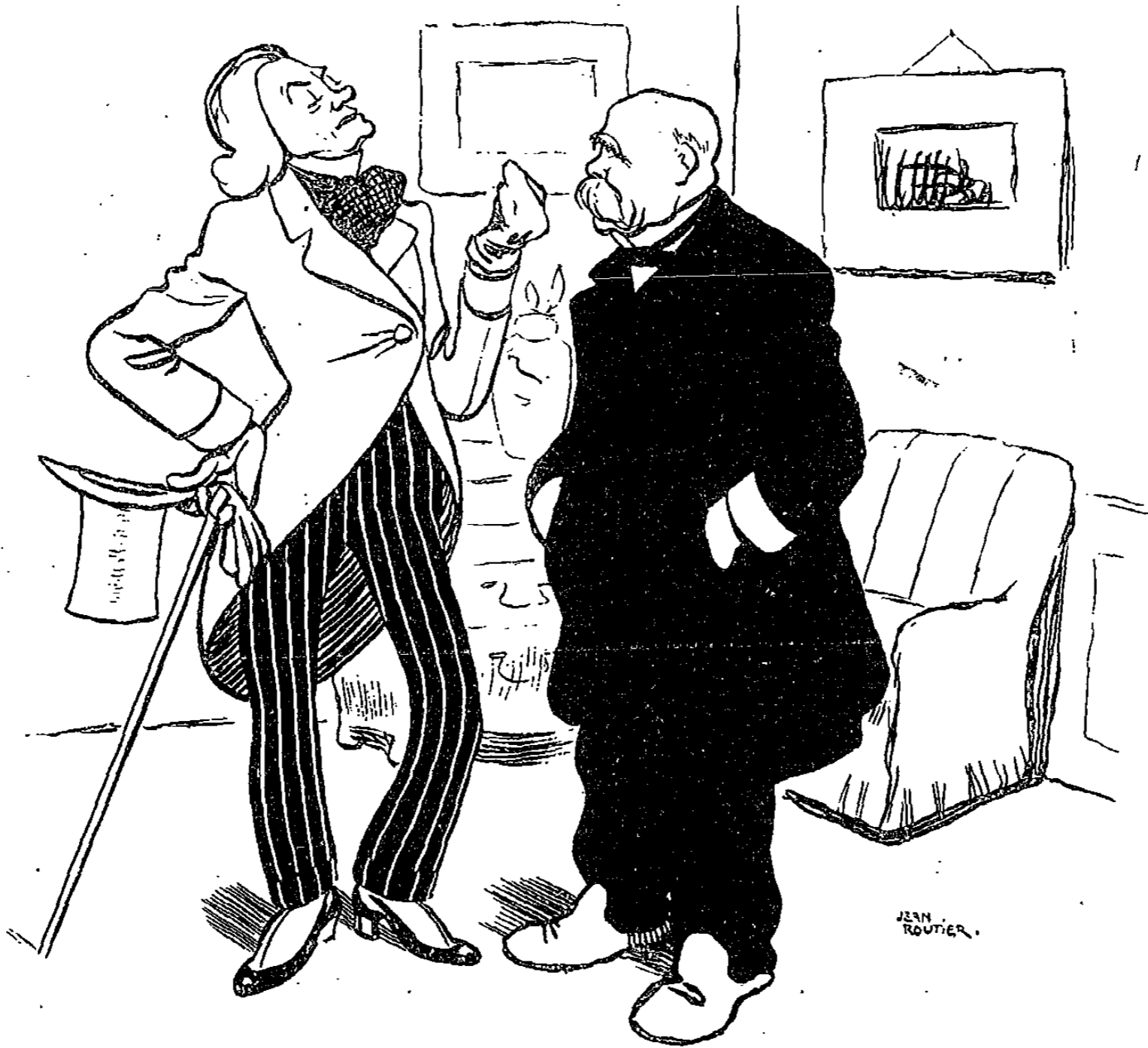
Talleyrand songea qu'il aurait plus de chance avec M. Clemenceau, chez lequel il se présenta vêtu à la mode du XIX e siècle... Cette interview fut interdite