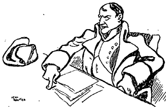
De mon temps, s'exclama Talleyrand, on approchait plus facilement de l'Empereur